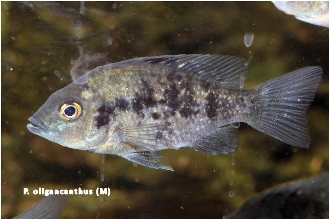
P. oligacanthus (M)

Ptychochromis grandidieri (Grössen S und M)