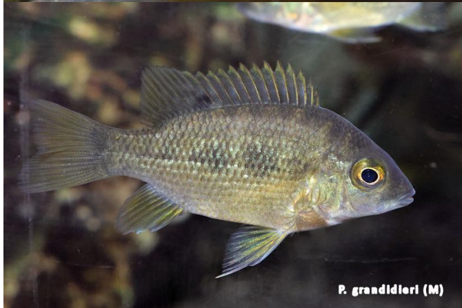
P. grandidieri (M)