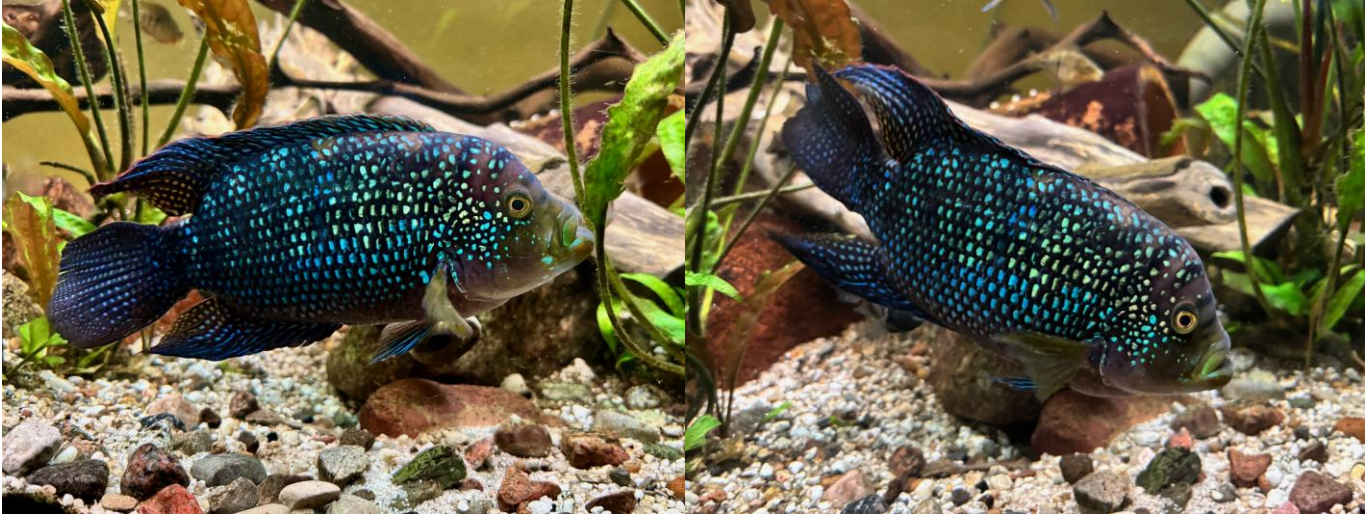
Foto zeigt Elterntiere ca. 3 Jahre alt

Amphilophus citrinellus barred-midas Lake Arenal / Costa Rica F2 2,5 -3,5 cm