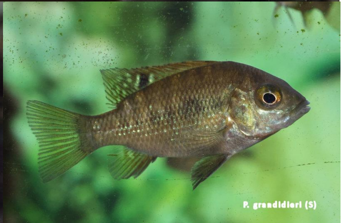
P. grandidieri (S)